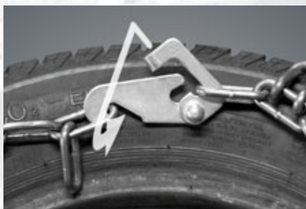
Ydre pallås på små kæder