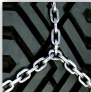
EASY TRAC udgave